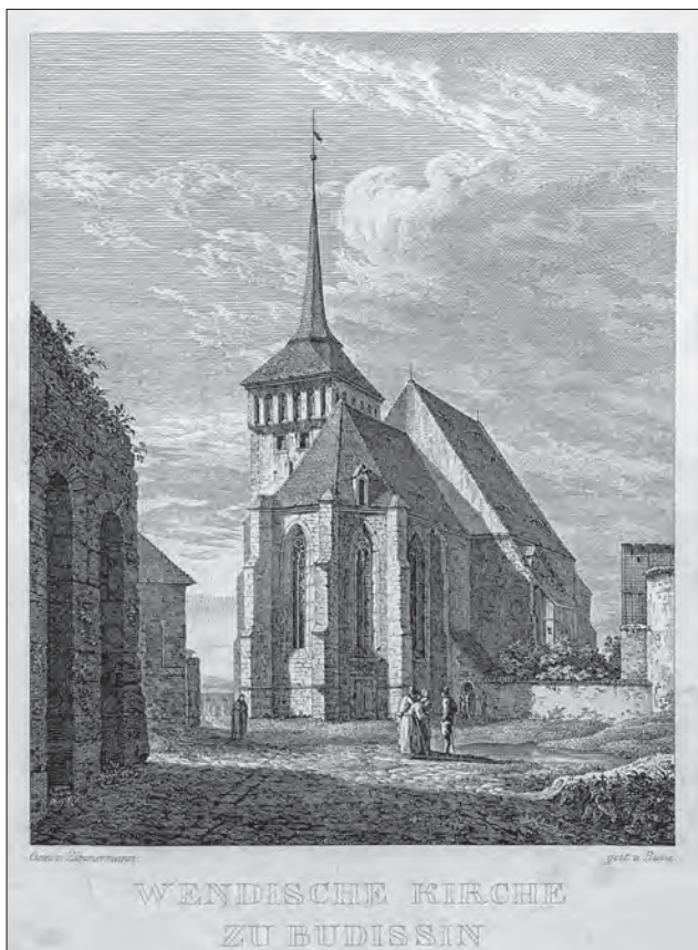
„Serbska cyrkej w Budyšinje“ w lěće 1831, raděrowanka Georga Heinricha Busse po rysowance Alberta Zimmermanna