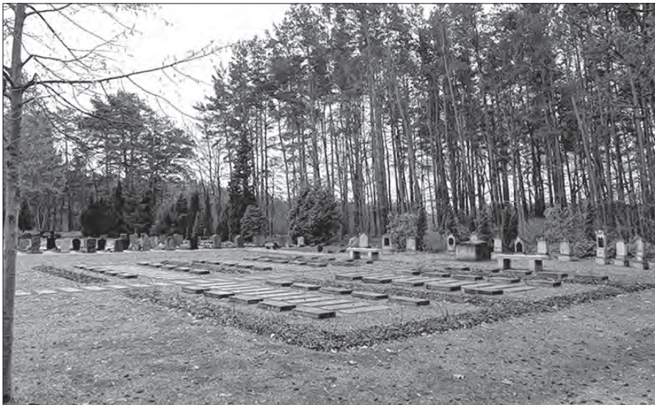
Na Rownjanskim pohrjebnišću je přihotowana płonina za rozšěrjenje wopomnišća ze starých serbskich narownych pomnikow.