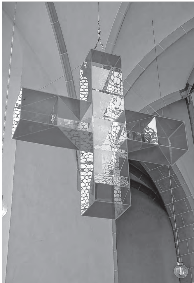
Wot Ludgera Hinsy stworjeny kříž w Michałskej cyrkwi

Hdyž w póstnym času Chrystusowy kříž wopominamy, tak njesteji za nas estetiski efekt wumělskeje twórby w srjedźišću, ale nabožna dimensija, kotraž je za nas zjewjena w słowje wo křížu, kotruž swět njeznaje a znać nechce, kotraž pak je za nas Boža móc k wumóženju a wobnowjenju swojeho žiwjenja.