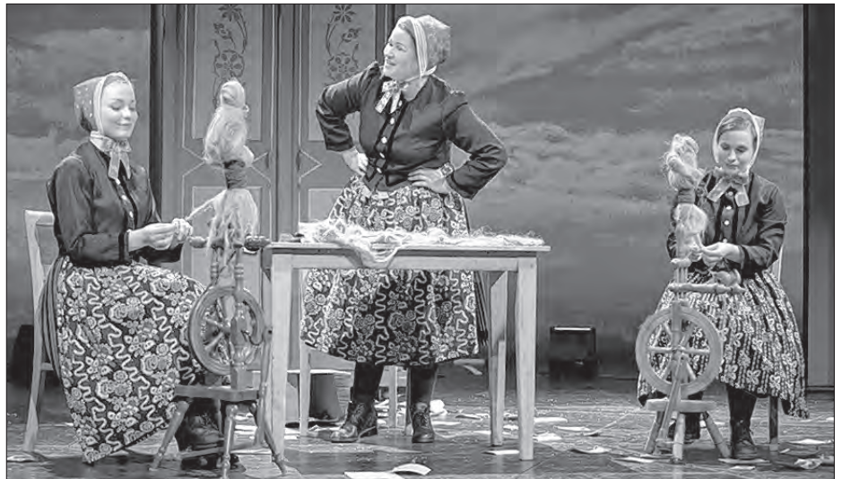
Scena přazy w dźiwadłowej hrě „Wopušćeny dom“

Jako započachu dźiwadźelnicy hru nazwućowac, njebě wotwidžeć, zo stanje so wona z reakciju na aktualne wuwice. Wšako je so hakle w februaru tuteho lěta doskónčnje rozsudziło, zo ma so Miłoraz wotbagrować. Tutón wosud a mějo nastawk Slepjanskeje fararki w měrcowskim čisle Pomhaj Bóh wo poslednich drastynoškach w Slepjanskej wosadže před wočo-