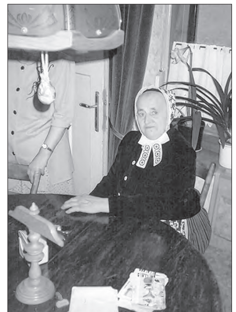
Hana Šprejcowá z Miłoraza

Na dwurěčnym pohrjebje předowaše fararka Jadwiga Malinkowa wo hesle z 46. psalma: „Bóh je naša nadžija a syl-