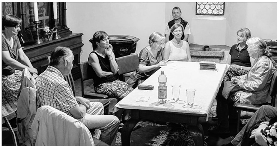
Wot biskopa podate nastorki diskutowachu wobdźelnicy w skupinach, kaž tu w sakristiji Michalskeje cyrkwe.

Přenja stacija běše hrajkanišćo při Michalskej cyrkwi. Tu móžachu dźěći z krydu molować abo papjerjane čolmiki paslić. Na kóncu dósta kóždy kołk. Tute kołki dyrbjachu so na wotpowědnych stacijach hromadzić, zo bychu dźěći na kóncu ⇒