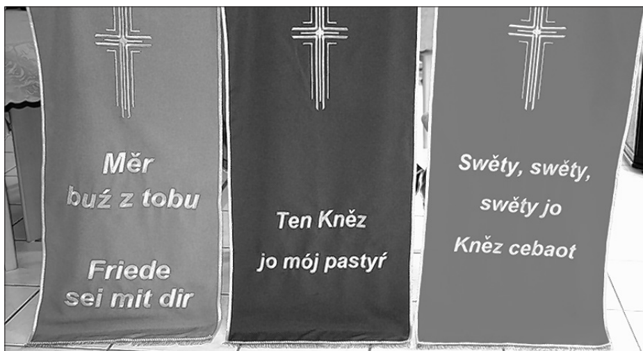
Nowe zelene, fijałkowe a čerwjene (wotlěwa) pultowe ruby za wužiwanje na delnjoserbskich kemšach

Tež zaramikowane wobrazy z delnjoserbskim Wótčenašom je spěchowanske towarstwo hižo wospjet sprěčenym wosadam darilo z próstwom, je na hódny mještne w cyrkwi powěšnyć. Werner Měškank