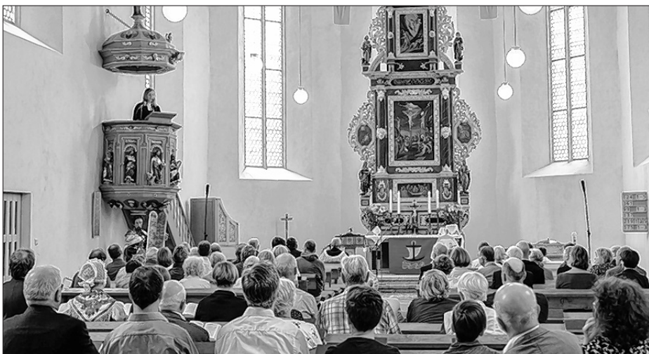
Njedźelniše kemše w Michalskej cyrkwi