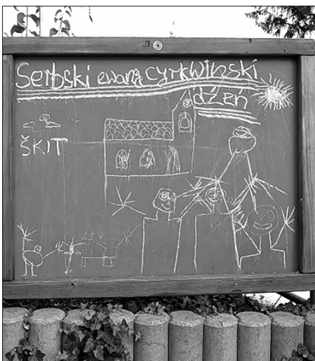
Wot džěci namolowany wobraz na tafli při Serbskim kěrchowje