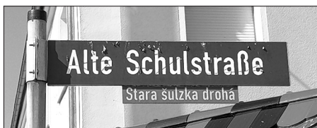
Spodźiwny serbski prawopis w Nowej Wsy nad Sprjewju

Malešecy. Na Bože spěće, 30. meje, zhromadźichu so wěriwi z wosadow wuchodnje Budyšina na dwurěčne kemše. Dokelž njebě lětsa w Malešecach wjesny swjedžen, běchu kemše w cyrkwi, štož dowjedze k snadnišemu wobdźelenju. Předowaše superintendent Malink wo přitomnosći Chrystusa tež po jeho nawróće do njebjes w jeho słowje, kotraž ma so do našich wutrobow dóstać. Kemše wobrubichu dujerjo z wokolnych wosadow.