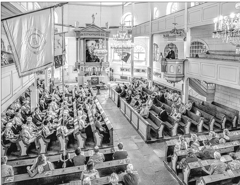
Džakne kemše w Bukečanskej cyrkwi k zakončenju wobnowjenja cyrkwineje wěže