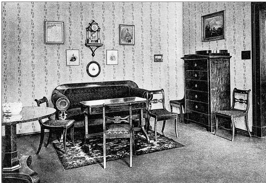
Historiski wobraz Jakubec stwy w Budyskim měščanskim muzeju