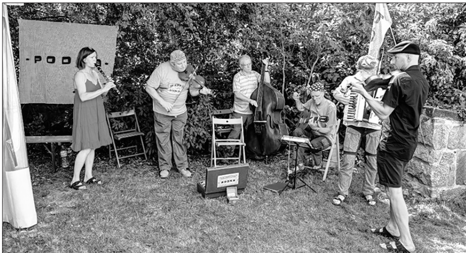
Skupina Podka z Drježdźan zawjeseli wopytowarjow sobotu popoždnu a wječor na Michalskej farskej zahrodźe.

Sobotniši wječor wuklinča ze swjedženjom na farskej zahrodźe. Při dobrej wječeri