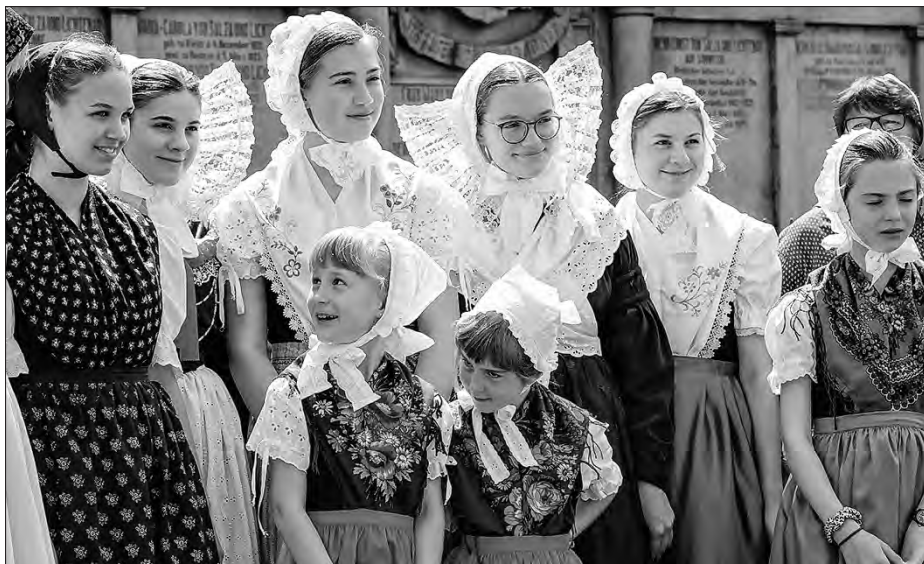
Člonki Bukečanskeje serbskeje drastoweje skupiny předstajichu wšelake warianty drasty ewangelskich Serbow Budyskeho kaja.

serbskich towarstwow, kotrejž spěchowachu přez čitanje zdobom kublanje w maćernej rěči.