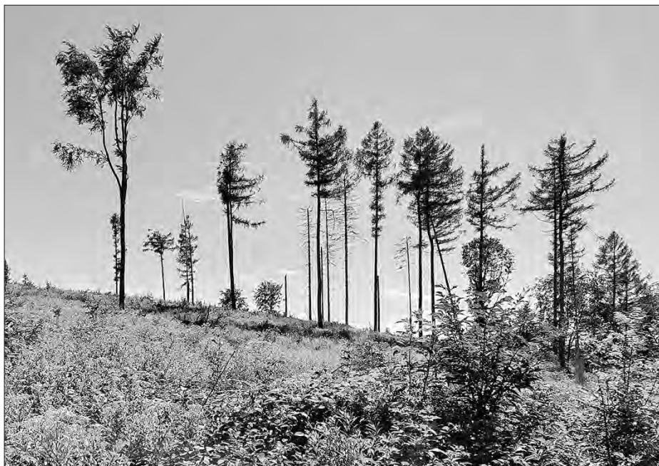
Lěs na Hromadniku