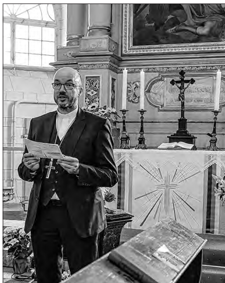
Sakski krajny biskop Tobias Bilz postrowi wodběžnikow cyrkwinskeho dnja.

Předsyda Serbskeho ewangelskeho towarstwa Mato Krygař pokaza na w žurli nastajene mobilne tafle wo skutkowanju Serbow w sakskej ewangelsko-lutherskej krajnej cyrkwi. Tute štyri nowe tafle prezen-