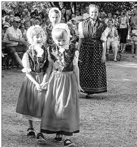
Tež mjeńše džeci běchu do předstajenja drasty zapřijate.