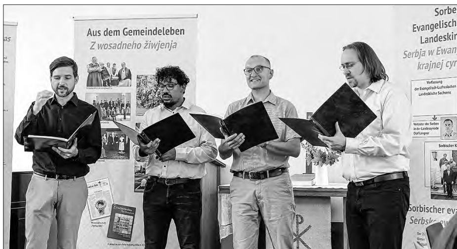
Skupina Poštyrjoch zanjese wjesole hornjo- a delnjoserbske pěsnje.