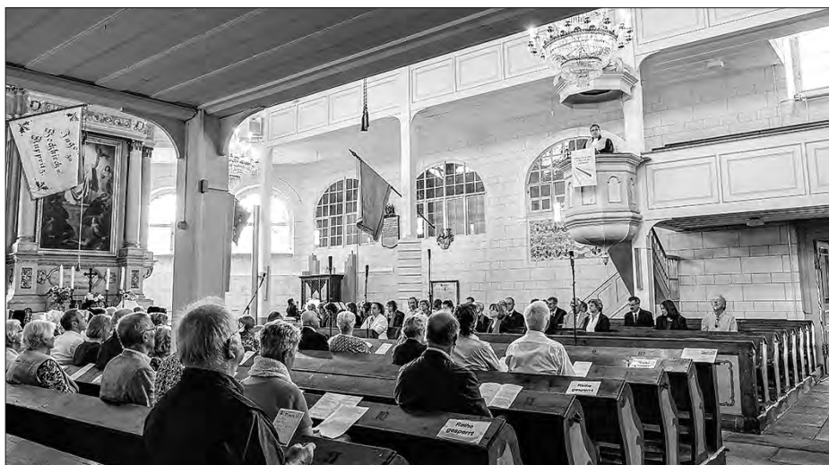
Njedzělniše kemše w Bukečanskej cyrkwi

Kulturny wjeršk cyrkwinskeho dnja bě njedzělu popołdnu předstajenje oratorija „Podlěćo“, na kotraž wosadny farar Tho-