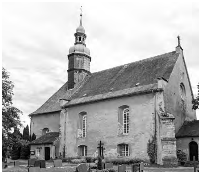
Cyrkej we Wósporku