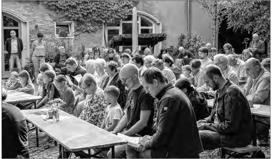
Ekumeniska serbska zhromadnosć na dworje Jaworkec/Maćijec statoka w Hrubjelčicach

Nawječor rozrosće ličba na dworowym swjedženju na wosomdzesat wopytowa-