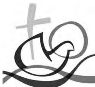
Logo ekumeniskeho swětowego zetkanja cyrkwjow

madže z dalšimi zastupjerjemi małych ludow rańšu modlitwu sobu wuhotować. Bě to jónkrótne dožiwjenje, nutrnosć z telko wobdźělnikami w stanje a při wobrazowkach swjećić. Tema tuteje bě wohroženje Božej stwórby přez naše skutkowanje, kiž so w jasnych słowach a wobrazach pomjenowaše.